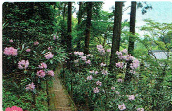
シャクナゲ 4月下旬

村内各所が桜色に染まる、散歩にもってこいの季節。本マップを片手にぜひ巡ってみてください。