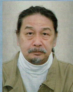
溝淵 雅幸 監督 映画監督